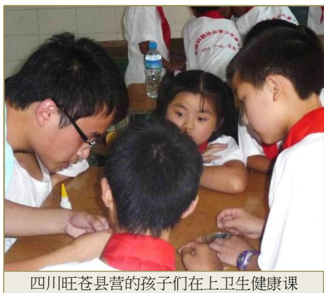
四川旺苍县营的孩子们在上卫生健康课

陕西师范大学的志愿者将天文知识带进山乡。他们从学校带去望远镜，指导斑桃镇的营员们观察夜空。美丽的星星将孩子们的心带到山外，梦想有一天自己也成为宇航员到太空遨游。