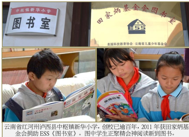
云南省红河州泸西县中枢纽新华小学，创校已逾百年，2011 年获田家炳基金会捐助 ESS《图书室》。图中学生正聚精会神阅读新到图书。

《认助乡村学校图书室》项目实施的过程需时约 8-9 个月，先由 ESS 协调联系捐款人，再由 ESS 在各省的代理人评选合格的学校提出申请，经 ESS 审核、分配，并与该县教育局及获资助的学校校长签署协议书，然后由学校挑选书目、购买图书，正式成立图书室、挂牌开放使用。获资助学校必须向捐赠者提供回馈资料原件（包括购书的帐单、书目、赠阅者图章样本、感谢信、图书使用情况、赠书仪式和图书室开放照片等），在学年结束前以空邮寄到美国 ESS 总部审核后，再由 ESS 转寄捐款人。在落实的过程中，ESS 尽量做到公开、透明、审慎、严谨、诚信，以期不辜负捐款者的期望和各地义工的辛劳。ESS 捐助者和义工亦会不定期到各乡村学校图书室实地考察访问，了解图书室使用的情况。