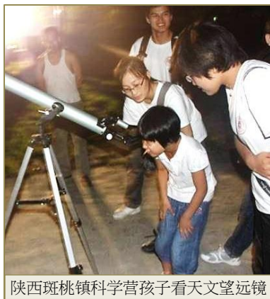
陕西斑桃镇科学营孩子看天文望远镜