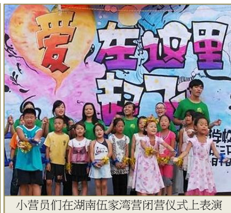
小营员们在湖南伍家湾营闭幕式上表演