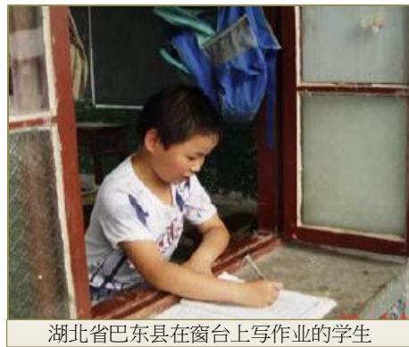
湖北省巴东县在窗台上写作业的学生

湖北省巴东县地处长江三峡之间，属湖北省恩施土家族自治州，是少数民族聚集的偏远山区和被国务院列为重点扶持的贫困县。县城因三峡建设须整体搬迁，移民人口达 4 万余人。从 2002 起，ESS 认助了巴东县《乡村学校图书室》88 所和《乡镇学校多媒体信息中心》1 所，并资助了 1 所学校的《儿童经典诵读》项目及 7 所学校的《乡村学校音乐》项目。