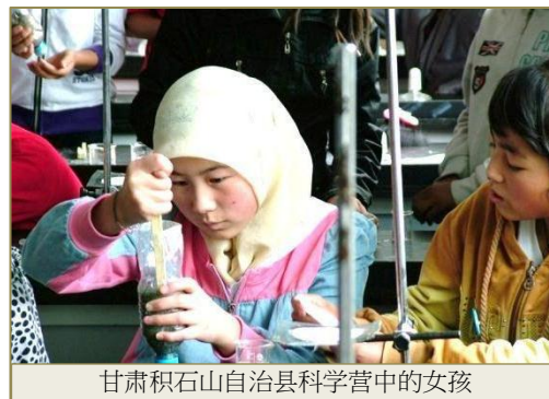
甘肃积石山自治县科学营中的女孩

积石山县科学营面临特殊的挑战。乧藏中学位于甘肃南部高寒地带的少数民族地区。当地有重商轻学的传统，很多孩子很早就辍学外出做生意，女孩子更是读不上几年书。学校的外墙上用大字写着“读完初中。”西北师范大学的王嘉毅校长亲自带领由年青教师和研究生组成的科学营志愿者来到这里，旨在通过提供丰富多彩的活动，改变学生们对学习的看法。科学营以当地环境保护为主题，吸引学生关心自己家乡的生态状况，教育他们只有懂得科学才能改善生存环境。今年的科学营正逢穆斯林斋期，更增加了一层困难。在志愿者的不懈努力下，一些不来也不请假的孩子被吸引来了，营员们在课内外的活动中都越来越活跃。特别是女孩子也积极参加。最后，科学营评出的十名优秀营员中有五名女孩。当地学校也从以前无所谓的态度转为大感兴趣。