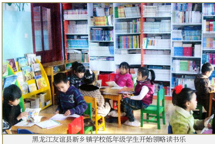
黑龙江友谊县新乡镇学校低年级学生开始领略读书乐

黑龙江友谊县有三校获 2011 年的 ESS《图书室》项目。其中友谊中学的图书是由持续赠书多年，曾下放到北大荒的知青所捐赠。学校在感谢信中对她说：“原想收获一縷春光，却得到整个春天。图书室除正常开馆时间外，每周为住宿生开放两个晚上，并坚持双休日和寒暑假全天开放。《图书室》由两个学生社团负责积极推动学校读书活动。”